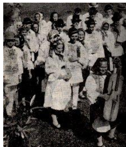
Nuntă la Valea Rece ( Lunca de Jos )