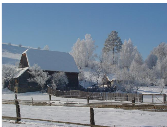
Peisaj de iarnă din Ghimeș – Valea Rece