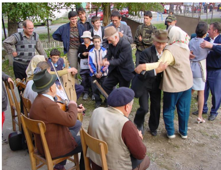
Petrecere în aer liber – Ungurește des