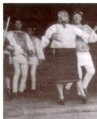
De doi roată