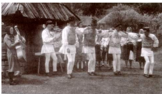
Heisa normală – Valea Pârâul Negru – 1979