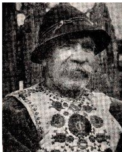
Bătrân din Lunca de Sus