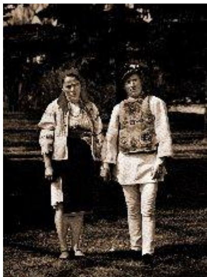
Pereche din Lunca de Jos