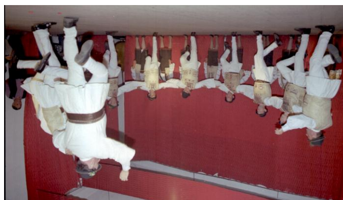
Heisa Dealului Lung